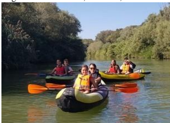
Scatti del PON "Imprenditorialità" alla scoperta dell'ecosistema del Saline

la riflessione civica; la didattica si apre ad ambienti di apprendimento di Comunità, con il progetto "Scuola al borgo" e le ricreazioni all'aperto che portano gli studenti a svolgere attività in luoghi di interesse storico-architettonico; gli scambi linguistici e culturali con scuole partner internazionali allargano gli orizzonti e potenziano in modo significativo le competenze linguistiche; le esperienze di ricerca sul territorio, che coniugano le scienze alla nuova tecnologia dei droni, rendono autentici gli apprendimenti.